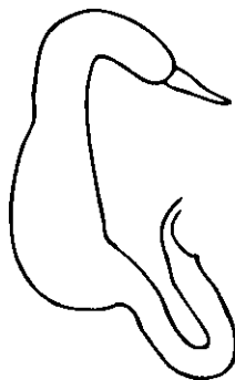
Fig. 2. Gioia mexicana . Espermateca.

Comentarios. Gioia mexicana está dentro del grupo de especies cuyos callos supraantanales no están bien separados por el surco longitudinal; sin embargo, se evidencia que la porción media anterior de ese surco es un poco más acentuado, pero borrosa en la porción restante. En su aspecto general se asemeja a G. furthi pero se diferencian, entre otros caracteres, por: color de las antenas, forma del surco transversal de la frente sobre los callos supraantanales y por el último ventrito del macho. También se asemeja con la especie G. jolyi , pero se diferencian, además de otros caracteres, por el ancho de la frente y la forma de los callos supraantanales. G. mexicana será incluido en el trabajo (en la clave) de las especies de Gioia de America Central (Savini y Furth, en preparación).